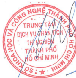
Trương Huỳnh Anh Vũ

1/ KẾT QUẢ NÀY CHỈ CÓ GIÁ TRỊ TRÊN MẪU THỬ/ THIS RESULT IS ONLY VALID ON TESTED SAMPLE. 2/ Thông tin về mẫu được ghi theo yêu cầu của khách hàng/ The sample information is written as customer's request. 3/ Không được sao chép toàn bộ hoặc một phần kết quả này dưới bất kỳ hình thức nào nếu không được sự đồng ý bằng văn bản của CASE/ No fully or partial of this result may be reproduced in any form without prior permission in writing from CASE.